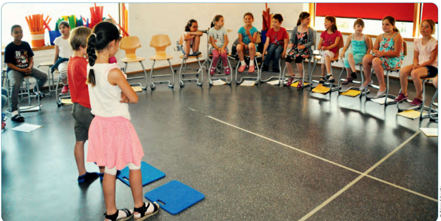
Die Klasse singt abwechselnd oder gleichzeitig die Silben des gesuchten Wortes, ein oder zwei Kinder erraten das richtige Wort.

■ Bei den Hörbeispielen auf der CD sollen die Schüler erkennen, welche Wörter gesungen werden. Das kann in Einzel-, Partner- oder Gruppenarbeit geschehen. ■